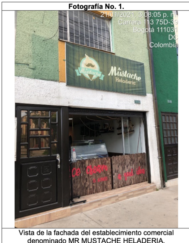
Vista de la fachada del establecimiento comercial denominado MR MUSTACHE HELADERIA.